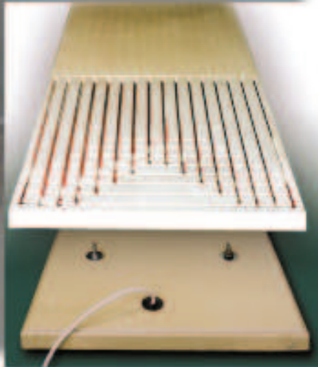
SOLNHOFENER QUALITÄT !!